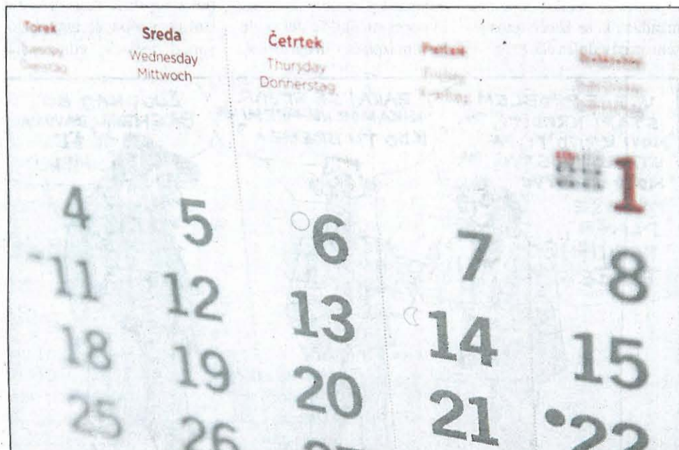
Prvi obrok tretje četrtine odprave plačnih nesorazmerij se nanaša na obdobje od 1. oktobra 2010 do 31. julija 2011, izplačilo mora biti realizirano do konca tega meseca. Drugi obrok za obdobje od 1. avgusta 2011 do 31. maja 2012 se bo izplačal do konca januarja 2015. S tem bo poročuna plačnih nesorazmerij v javnem sektorju v celoti odpravljen.

Odprava plačnih nesorazmerij je za vsa slovenska tožilstva znašala dobrih 128.000 evrov, upravičencev za izplačilo je bilo 443. »Poračun se je izplačal iz sredstev za plače za leto 2014,« so pojasnili na Vrhovnem državnem tožilstvu.